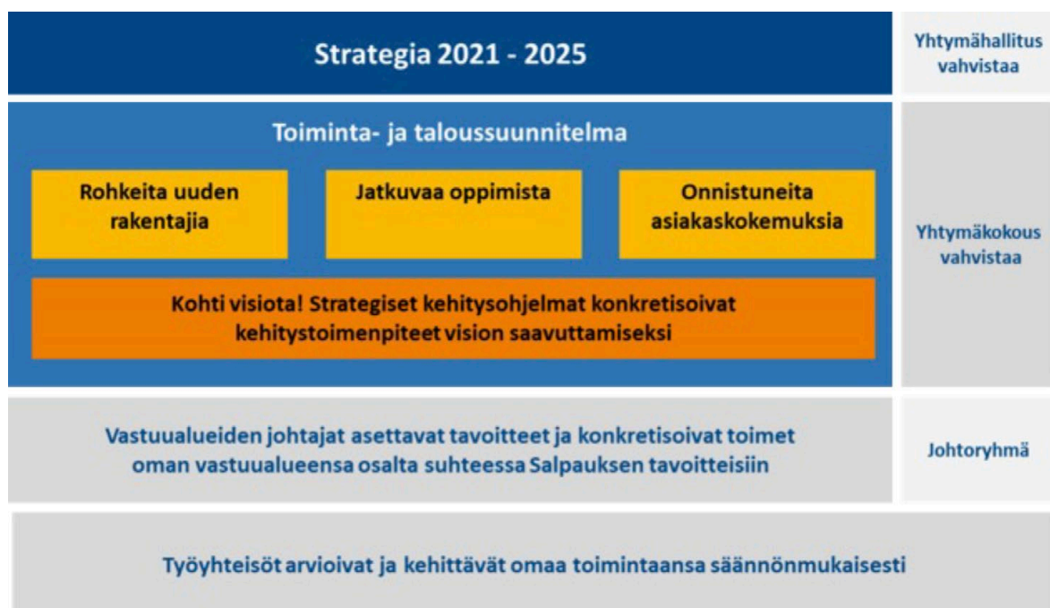
Kuva 5. Kaavio Salpauksen strategiasta 2021–2025.

Alla on käsitelty jokaisen strategisen kehitysohjelman tavoitteiden toteutumista erikseen. Poikkeuksena taloudelliset tavoitteet, joita käsitellään kokonaisuutena seuraavassa kappaleessa. Tavoitteet ja niiden toteutuminen on avattu alla olevissa eri osa-alueita kuvaavissa kappaleissa. Tavoitteiden toteutumista seurataan säännöllisesti johtoryhmässä ja yhtymähallituksessa.