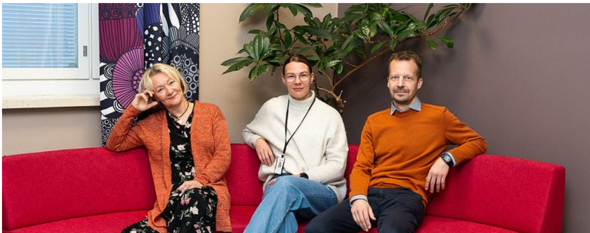
Kuva 2. Liiketoiminnan alan opetushenkilöstöä Lahden keskustakampuksella.

Kuntalain 121 §:n mukaan tarkastuslautakunnan on valmisteltava yhtymäkokouksessa päätettävät hallinnon ja talouden tarkastusta koskevat asiat. Tarkastuslautakunta myös arvioi, ovatko yhtymäkokouksen asettamat toiminnalliset ja taloudelliset tavoitteet kuntayhtymässä toteutuneet ja onko toiminta järjestetty tuloksellisella ja tarkoituksenmukaisella tavalla.