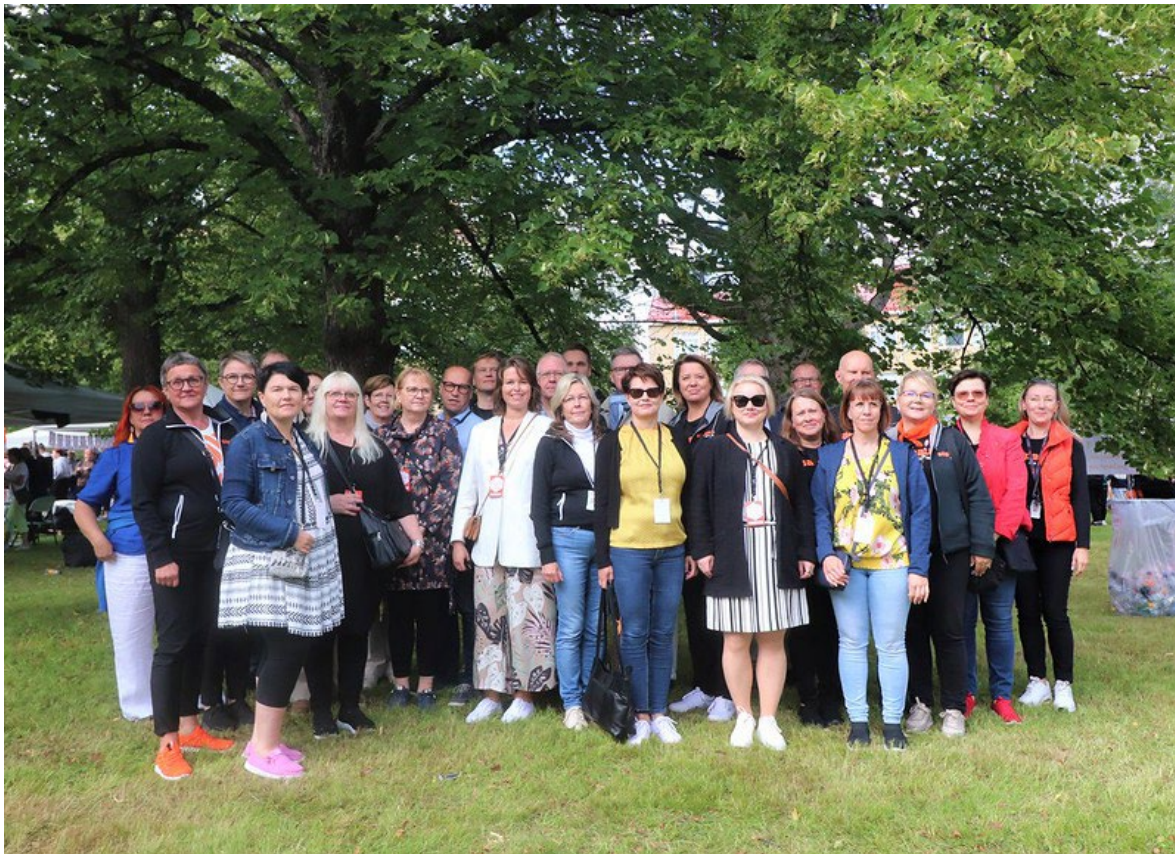
Kuva 4. Vieraita OSAOsta, Sedu Seinäjoen koulutus kuntayhtymästä ja Kajaanin kaupungin koulutusliikelaitos KAO:sta yhteisen benchmarking-verkoston tapaamisen tiimoilta.

Seuraavaan taulukkoon on kerätty vuoden 2022 arviointikertomuksessa todettuja keskeisimpiä havaintoja tavoitteisiin ja niiden toteutumiseen liittyen ja myös niihin annettuja vastineita.