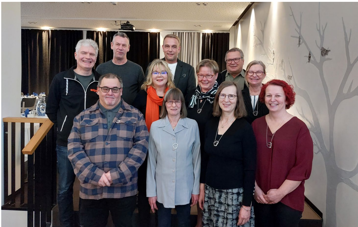
Kuva 8. Työmerkkipäiväjuhlassa juhlustetaan 20, 30 tai 40 vuotta kuntayhtymän palveluksessa työskennelleitä salpauslaisia.

Salpauksessa on kiinnitetty erityistä huomioita henkilöstön koulutukseen, perehdyttämiseen ja työhyvinvointiin, mikä osaltaan parantaa Salpauksen kilpailukykyä työmarkkinoilla.