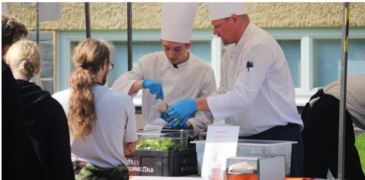
Kuva 1. Salpauksen opiskelijoiden ja henkilöstön Kyläjuhliissa ruoka on aina yksi odotettu ohjelmanumero.